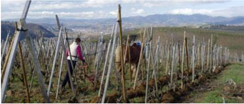
Le cheval a fait son retour dans les vignes